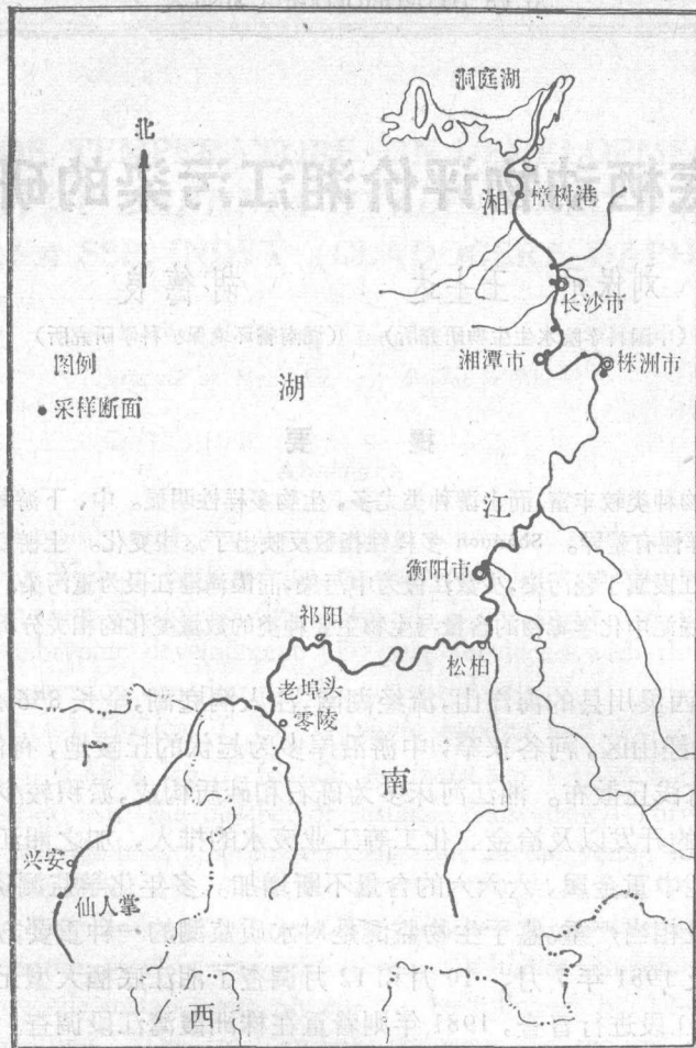
图1 湘江干流采样断面示意图